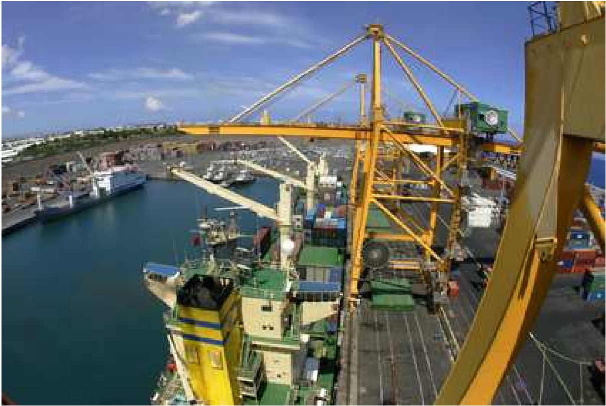
Le Port, île de La Réunion : un carrefour économique et culturel

Mis en service en 1886, le port de commerce de la Pointe des Galets a entraîné la création de la commune de « Le Port » en 1895. Elle compte aujourd'hui 40 000 habitants et attend 20 000 habitants de plus en 2030.