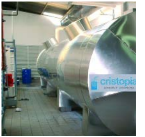
Cuve de stockage avec nodules (avec liquide à changement de phase).