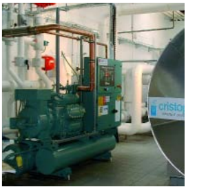
Groupe Froid.

Gain direct : 61 MWh/an, soit 3% Gain indirect : 144 MWh/an, soit 7%